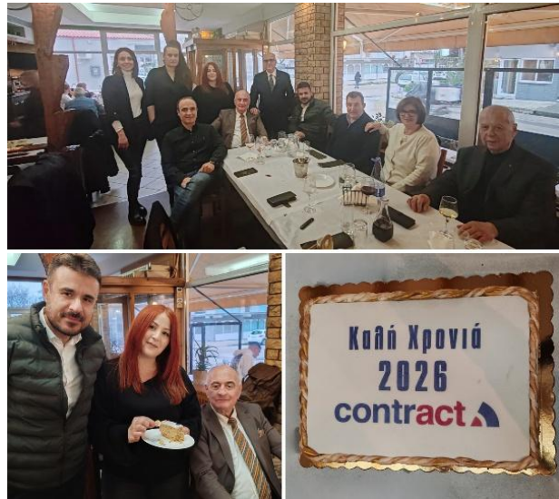
Εικόνα 3 Κοπή Πίτας στην Ορεστιάδα

Παράλληλα, στο πλαίσιο των εκδηλώσεων, στα Ιωάννινα πραγματοποιήθηκε η πρώτη δια ζώσης εκπαιδευτική συνάντηση του Contract Network για το 2026 , όπου η κοπή της πίτας συνδυάστηκε με εκπαιδευτικό σεμινάριο σε συνεργασία με την εταιρία Interamerican .