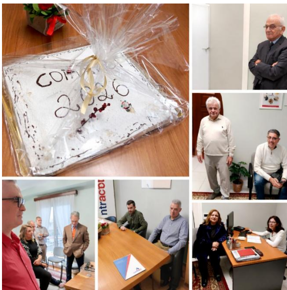
Εικόνα 8 Κοπή Πίτας στον Πειραιά

Ιδιαίτερη σημασία είχε και η κοπή πίτας στο υποκατάστημα της εταιρίας στον Πειραιά, το οποίο λειτουργεί πλέον σε νέα διεύθυνση, στη Λεωφόρο Ηρώων Πολυτεχνείου , έναν ιστορικό και εμβληματικό δρόμο της περιοχής και δίπλα στο Δημοτικό Θέατρο Πειραιά , ένα από τα σημαντικότερα νεοκλασικά μνημεία της χώρας.