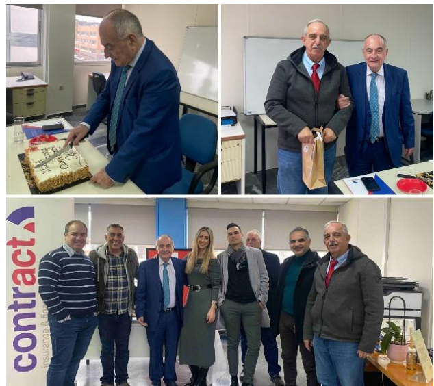
Εικόνα 6 Κοπή Πίτας στην Πάτρα