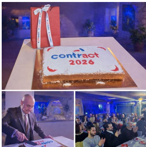
Εικόνα 1 Κοπή Πίτας στην Καβάλα

Η Διοίκηση επέλεξε για το 2026 να επισκεφθεί προσωπικά τους συνεργάτες και τα υποκαταστήματα του δικτύου, κόβοντας πίτες κατά τόπους , και συνδυάζοντας γεύμα και ουσιαστικό χρόνο συζήτησης με τους συνεργάτες της στην περιοχή, ενισχύοντας το κλίμα εγγύτητας, αναγνώρισης και κοινής πορείας.