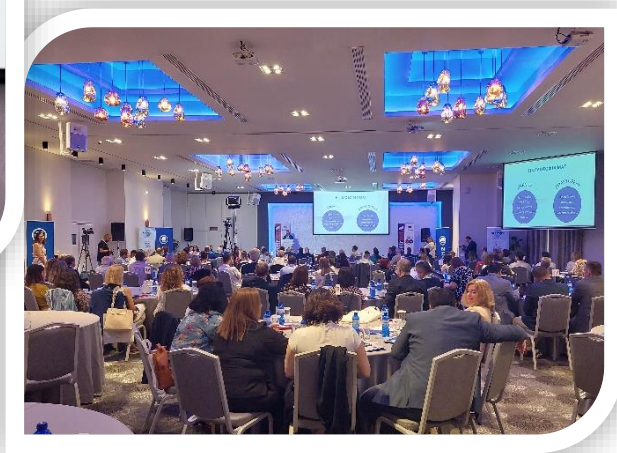
Εικόνα 2 Συνέδριο Contract