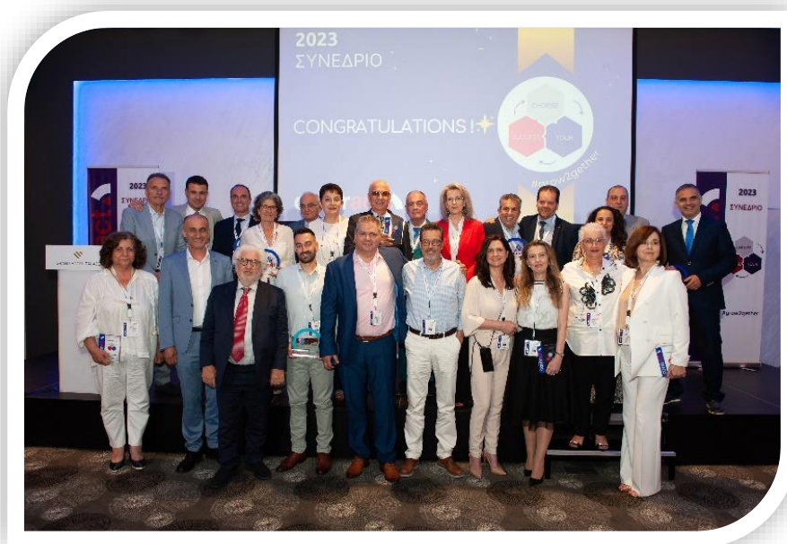
Εικόνα 6 Στιγμιότυπο από την τελετή βραβεύσεων

Το συνέδριο ολοκληρώθηκε με γέυμα σε εορταστικό κλίμα και τις θερμές ευχές όλων για ακόμη μεγαλύτερες επιτυχίες και κοινή αναπτυξιακή πορεία!